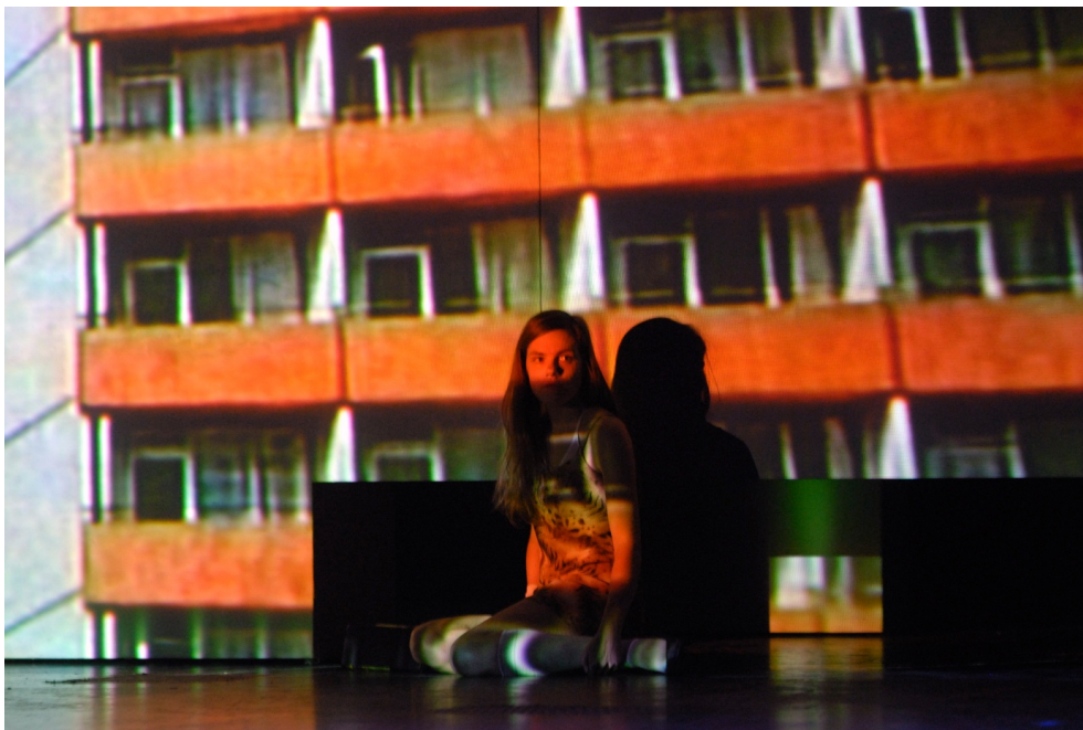
Abbildung 1: Heaven (zu Tristan)

So kündigte das Maxim Gorki Theater Berlin die Uraufführung des Stückes Heaven (zu Tristan) von Fritz Kater an. Kein leichter Stoff. Sowohl die literarische Vorlage als auch der inszenatorische Zugriff erfordern viel Insiderwissen, sowohl was die Situation in Ostdeutschland als auch die intertextuellen und historischen Bezüge betrifft. Dieses soll dem Publikum in theaterpädagogischen Workshops auf spielerische Weise vermittelt werden. Dabei macht der interaktive Ansatz die Arbeitsweise im Theater auf sinnliche Weise transparent.