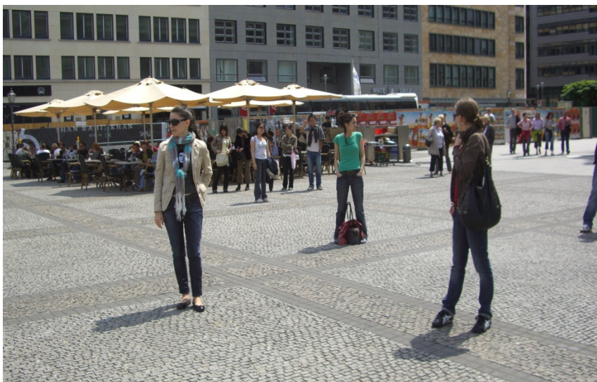
Abbildung 3: Personeninstallation

Wir machen einen Abstecher zum großen Gendarmenmarkt und ich rege an, eine Personeninstallation zu versuchen, indem wir markante Orte in der Stadt durch uns selbst zueinander positionieren.